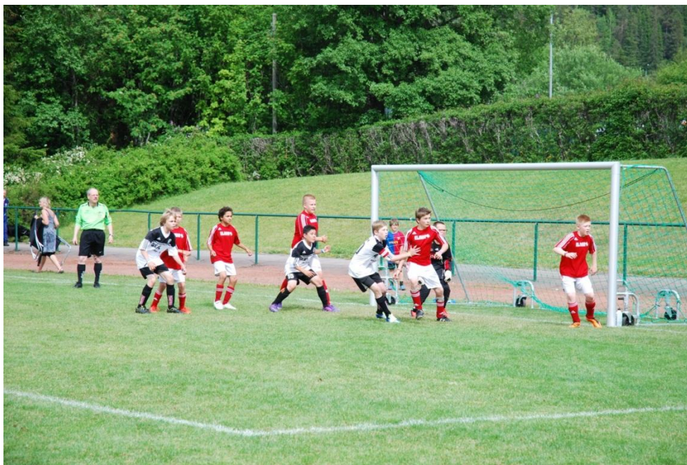
Gutter 12 år

Våre lag har representert Stiklestad på mange cuper i distriktet, og jenter og gutter 12, 13, 14 og 16 år har også deltatt på Storsjø-cup i Østersund.